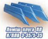
Леміш плуга ПП Н/ПЛВ 3-35/5-35