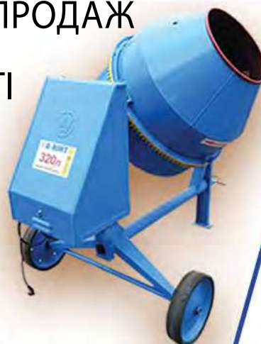
Бетонозмішувач BWA-200 320 л