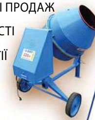
Бетонозмішувач BWA-200 320 л

м.Бердичів, вул.Низгірецька, 167 +38 067 410 07 74 +38 067 412 13 45 +38 067 411 67 20 www.a-wikt.com.ua