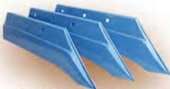
Леміш плуга ПЛ П/ПЛВ 3-35/5-35